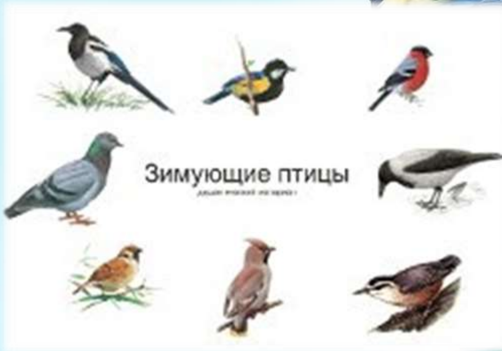
Зимующие птицы дальше вставки не нужны

Очень трудно приходится птицам зимой. Главные враги птиц - холод и голод. Много птиц погибает от холода во время метелей и сильных морозов. Но ещё страшнее для птиц – голодная зима. Особенно часто гибнут птицы в конце зимы, когда почти весь корм повсюду съеден.